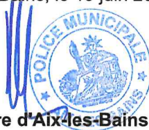
Le Maire d'Aix-les-Bains Renaud BERETTI